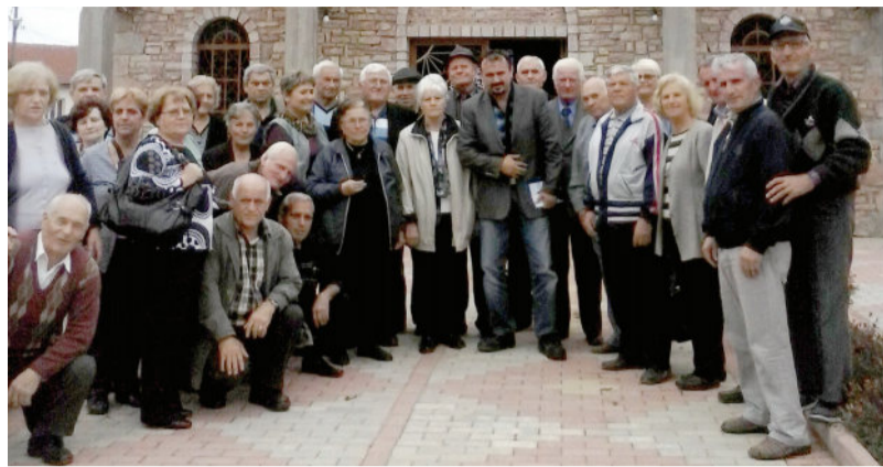
Пензионерите од Велес и од Неготино реализираа хумана и благородна мисија

Но, по завршувањето на Првата светска војна, до 1924 година овој регион беше под воена управа на француските власти, кои им дозволија на автохтоните Македонци да се изјаснат преку референдум во која држава да