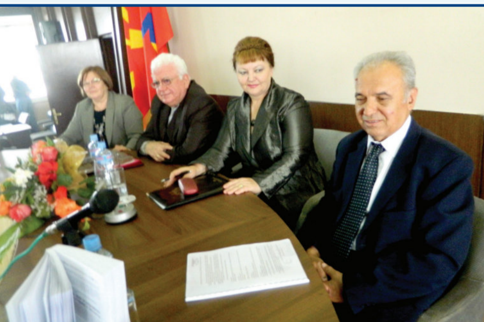
Секој напис во книгата е со цел да се подобри квалитетот на животот на пензионерите

И на крајот, овој регион со вистински Македонци заслужува внимание - таму ќе нè има многу повеќе и многу подолго отколку на истокот, а на југот веќе ги снемума претопувајќи ги младите Македонци во некој друг народ. Токму поради нашиот опстанок и нашата вечност постојано треба да се посетуваме дека Пустец со Малопреспанци не е во пустелија. Тие се тука, до нас, покрај нас и со нас. Заминавме со надеж за покоро да се вратиме.