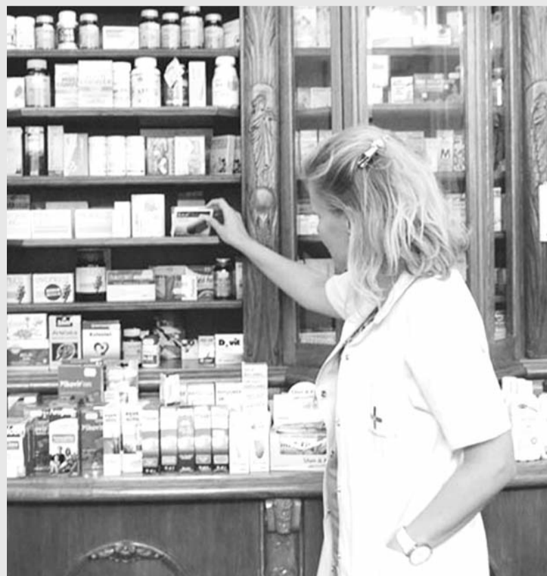
Досега се намалени цените на повеќе од 1.800 лека

Се намалуваат цените и на лековите за кардиоваскуларни заболувања, дел од антибиотиците, препарати за лекување гастрозаболувања итн. Голем број соседни земји Македонија ја земаат за референтна земја во делот на цените. Тоа нè охрабрува дека имаме добро разработен систем што дава резултати.