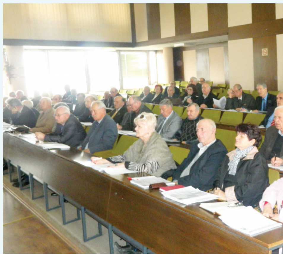
На седницата беше повторена заложбата за издигање на стандардот и на квалитетот

Организирани се повеќе успешни и масовни пикник-средби на кои се дружеа и го ширеа пријателството по над 5.000 пензионери. На овие пикник-средби, како и на неколку други, се говореше за значењето на Европската Унија и за акцијата за активно стареење, меѓугенерациска соработка и солидарност.