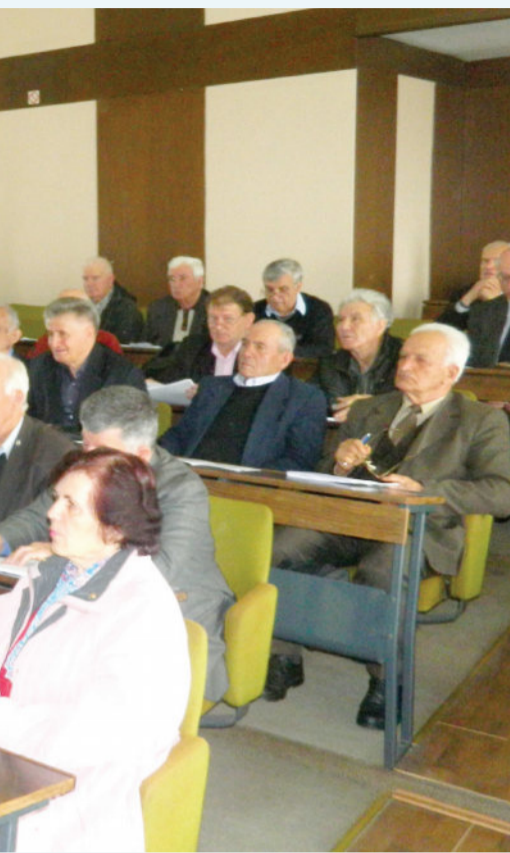
Тетот на живот на членството на што повисоко ниво

стувања на електронски медиуми и дневни весници.