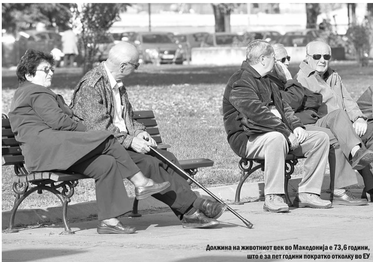
Должина на животниот век во Македонија е 73,6 години, што е за пет години пократко отколку во ЕУ