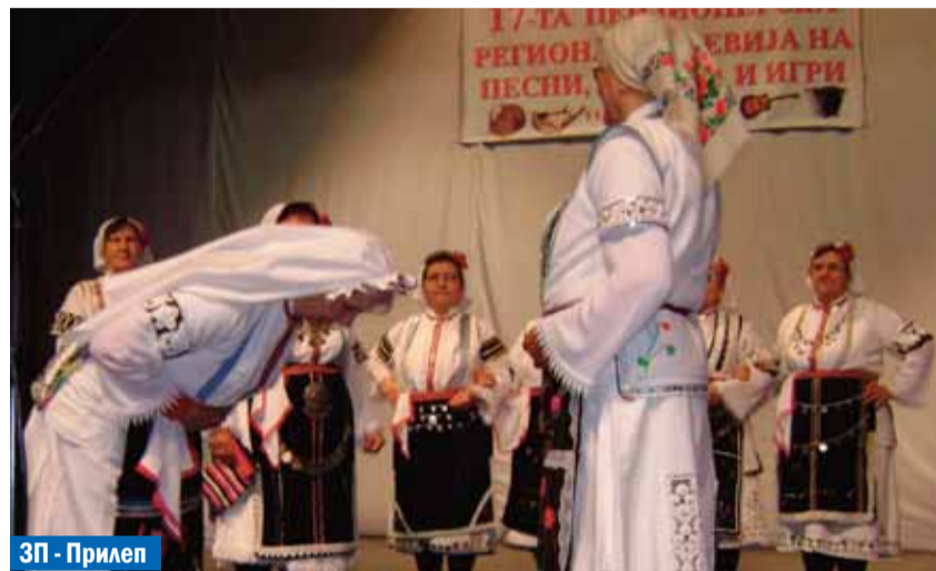
ЗП - Прилеп