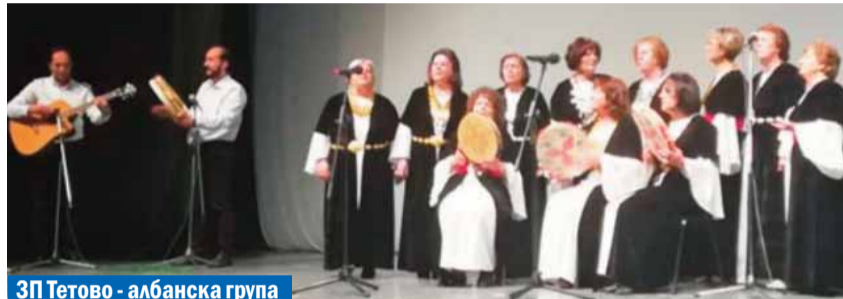
ЗП Тетово - албанска група