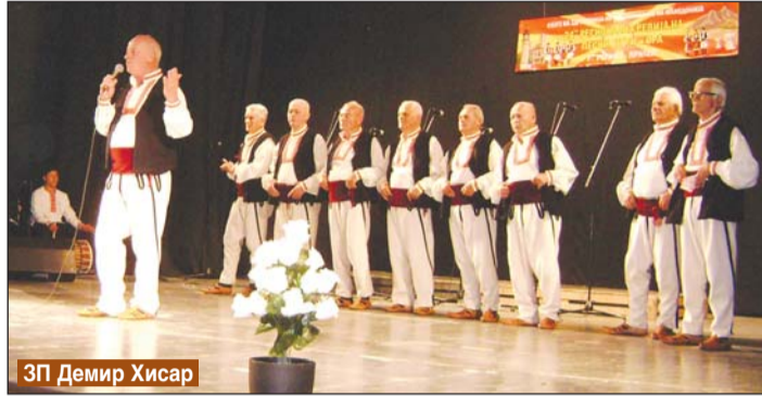
ЗП Демир Хисар